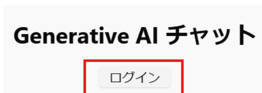
チャットアプリ ログイン前トップページ

登録ユーザは初回ログイン後、パスワードを変更を促す画面が表示されますのでパスワードを設定する必要があります。