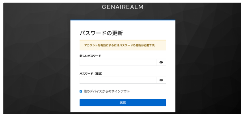
初回ログイン後のパスワード変更画面

チャットアプリのログイン画面から登録したメールアドレスとパスワードを用いてログインが可能となり、本サービスの対話機能を利用することができます。