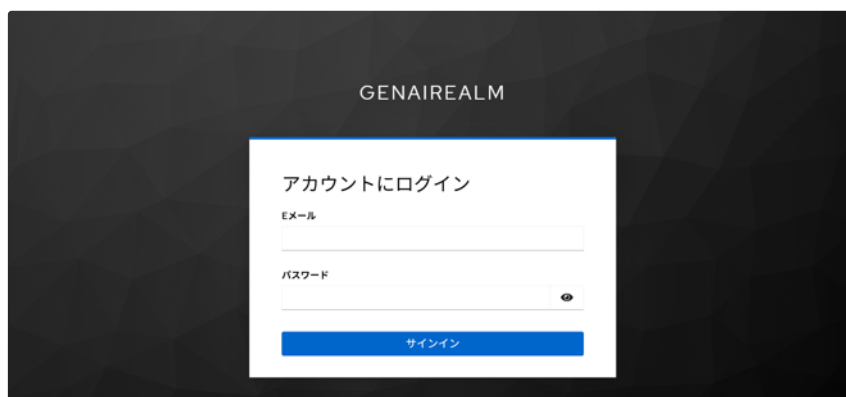
チャットアプリのログイン画面